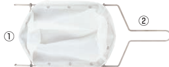
※フィルターとフレームは別売りです。

実際に使用していただいたカレー店ではひと月に使用する一斗缶が10本から7本に削減されました。