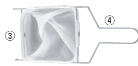
※フィルターとフレームは別売りです。